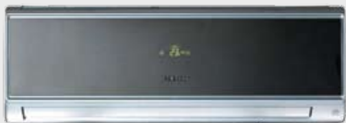
Model s tónovaným zrkadlom