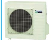
RYN 50, 60 E